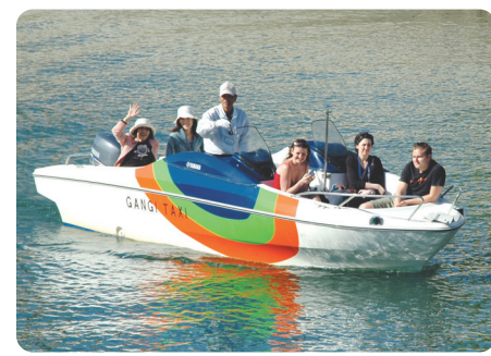
川から見る広島 えんこうがわ のまちはとても新鮮。

広島市内に約300カ所ある雁木を水上交通の船着場として活用するのが「雁木タクシー」です。水の都ひろしまを流れる6本の川のどこにでも行きます。観光に、お買物に、通勤に、お気軽にご利用ください。